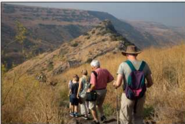
Wanderung nach Gamla