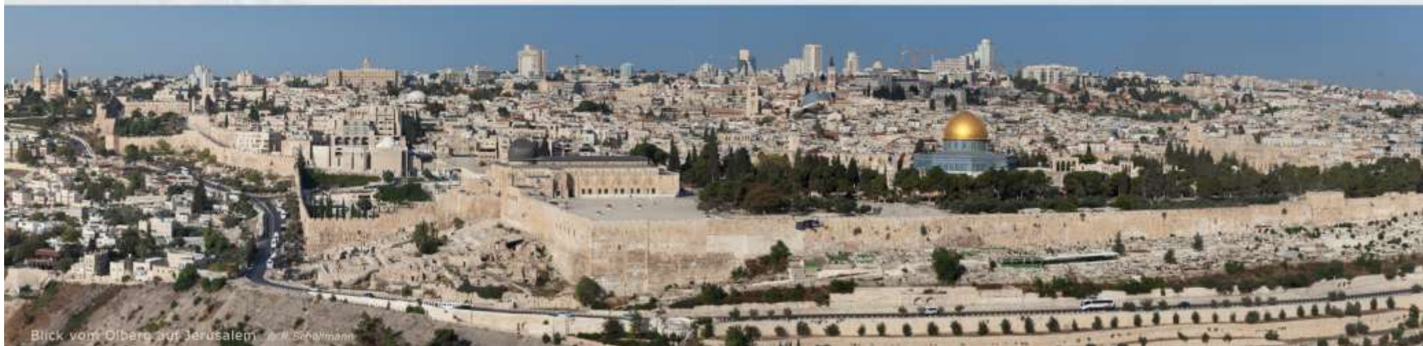
Blick vom Ölberg auf Jerusalem