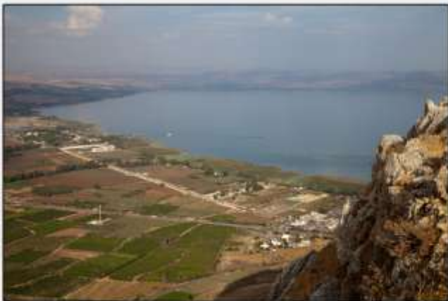
Blick vom Arbel auf den See Genezareth