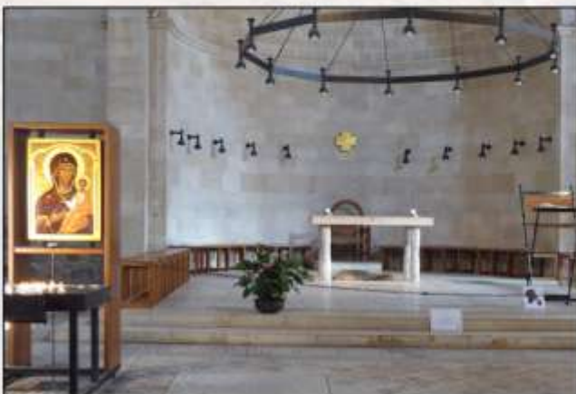
Kirche der Brotvermehrung

Wir wissen, die Reise hat ihren Preis, aber die Unterbringung im einzigen guten Hotel in der Altstadt von Jerusalem (5 Minuten zur Grabeskirche) ist genial und ist es uns wert.